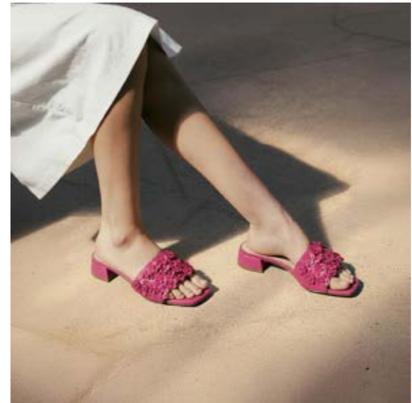
ART: 2983 FONDO: T. 3318 PQ NAPPA FUCSIA SUOLA TUNIT TOMAIA: NAPPA FUCSIA