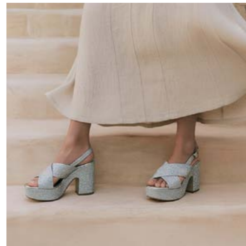
ART: 2870 FONDO: TACCO GIVI GALAXY ARGENTO SUOLA TUNIT TOMAIA: GALAXY ARGENTO